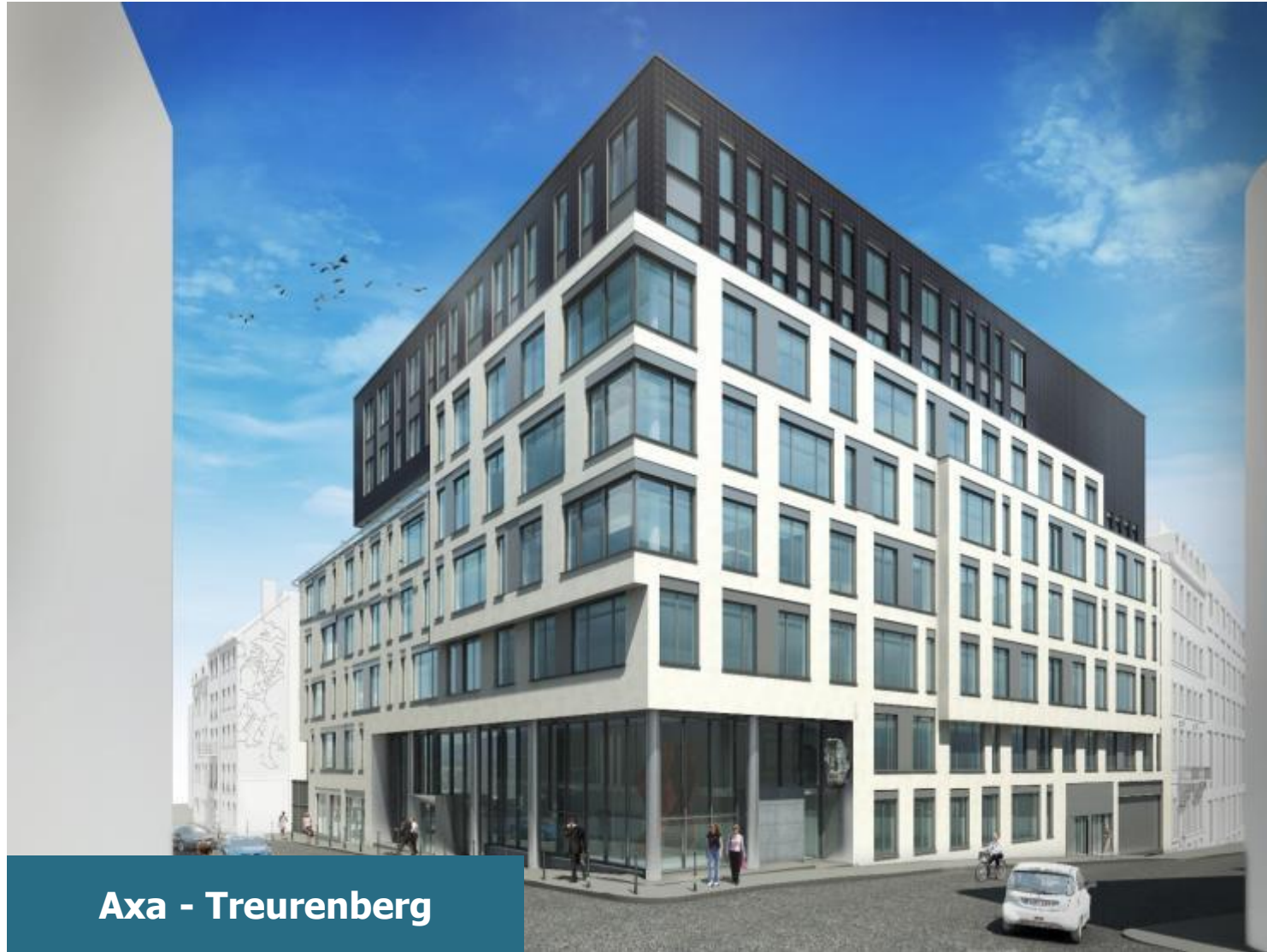
Axa - Treurenberg