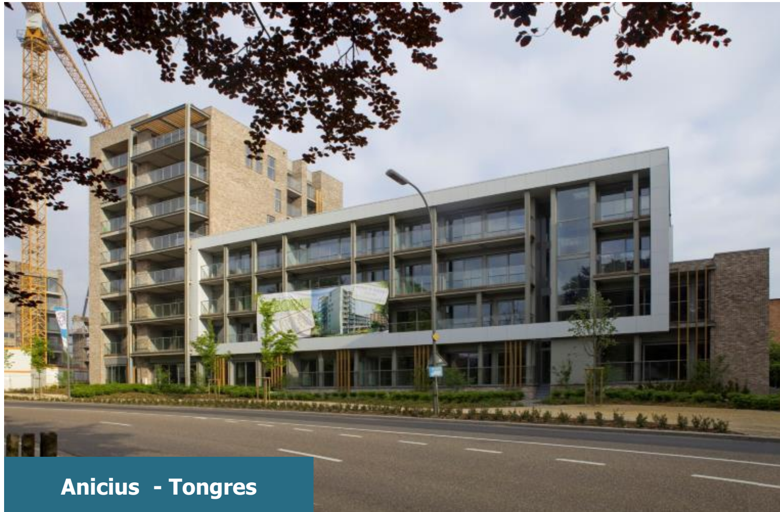
Anicius - Tongres