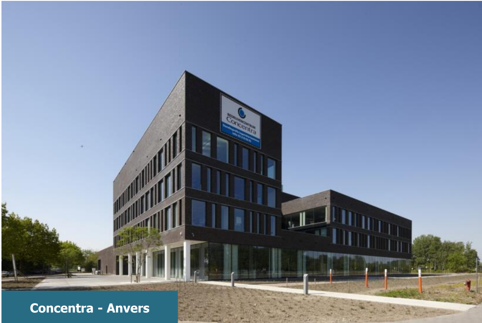
Concentra - Anvers