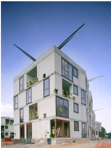
© Pierre Blondel Architectes sprl – Foto : Y. Glavie