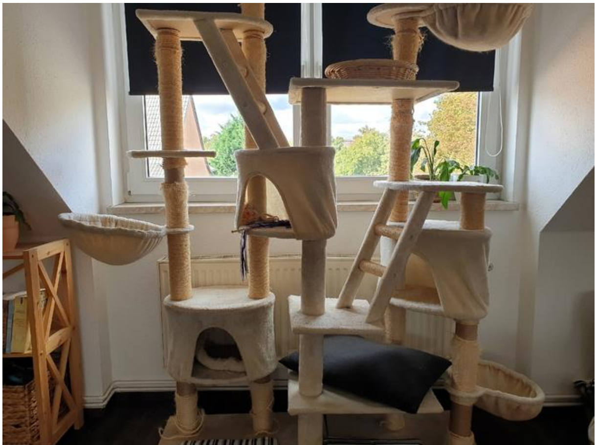
Figure 1 : Arbre à chats avec des observatoires, cachettes et zones de repos.