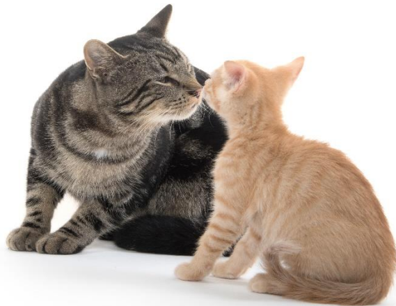
Figure 5 : Si les chats s'apprécient, le contact physique entre eux peut être un plaisir.

Si vous prenez deux chatons de différentes portées en même temps, cela fonctionne généralement mieux qu'avec des chats adultes inconnus. Si vous gardez les chatons d'une même portée, ou la mère avec un ou plusieurs de ses chatons, cela fonctionnera généralement mieux. Ils peuvent former une " famille " avec de bons rapports quotidiens. Lorsque les chats forment un groupe social paisible, le jeu et le contact physique entre eux (se laver, se donner la tête, dormir ensemble) peuvent être agréables pour tous les chats concernés.