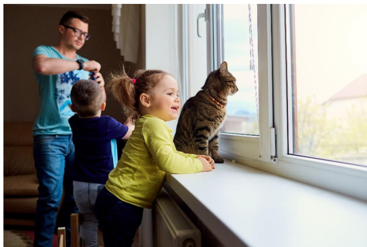
Figure 4 : Surveillance parentale des enfants à proximité des chats.

Les jeunes enfants doivent être surveillés par leurs parents lorsqu'ils sont à proximité de chats.