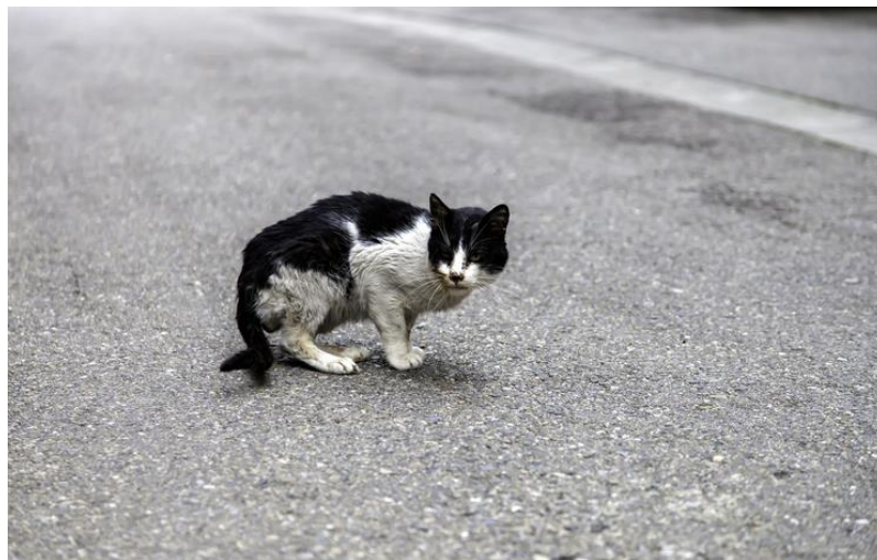
Figure 6 : Signes de mal-être, détresse ou inconfort chez un chat.