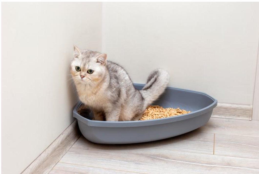
Figure 2 : Litière pour chats.