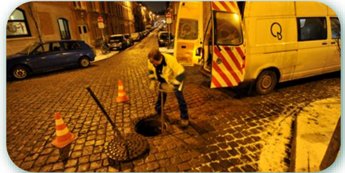
Distribution eau potable