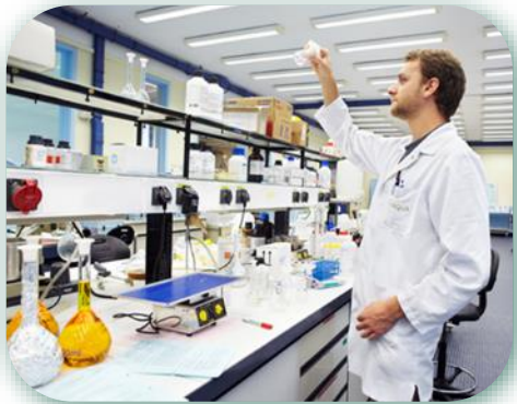
Production eau potable