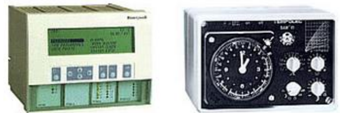
Régulateur numérique et régulateur analogique.